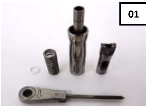
Torquímetro Mecânico desmontado